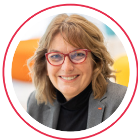
Cécile de Saint Michel Présidente du Conseil national de l'ordre des experts-comptables